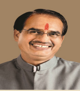
शिवराज सिंह चौहान मुख्यमंत्री